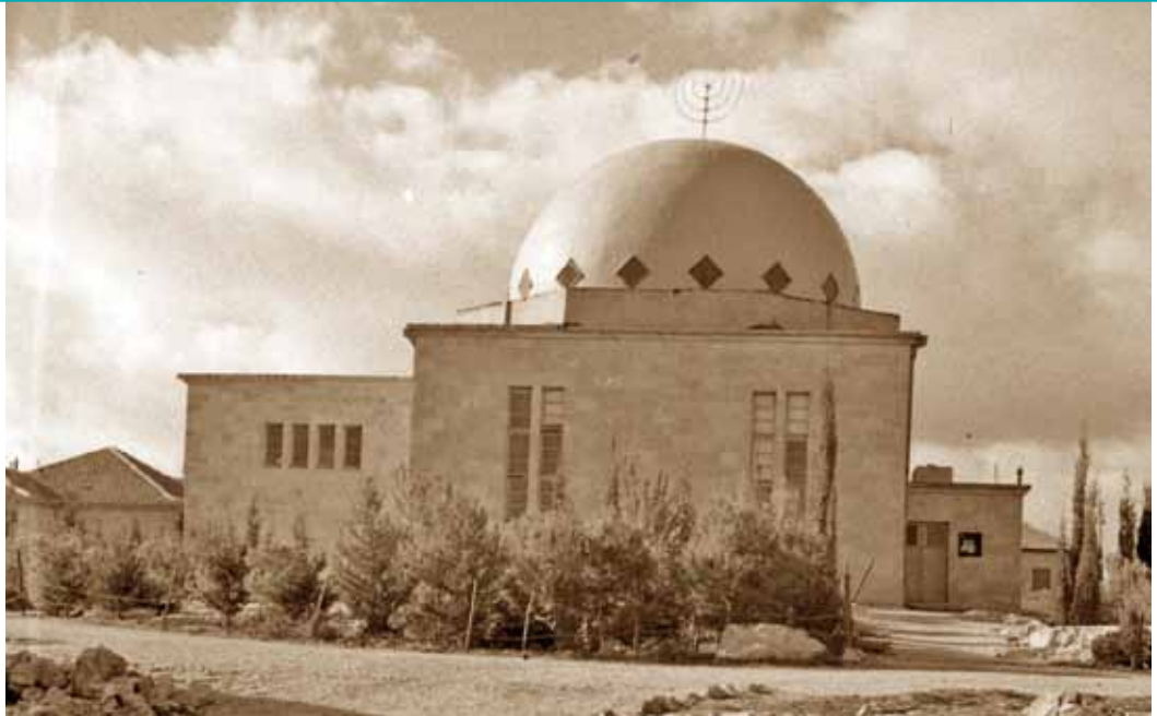
הובטח לתורמים כי יקראו על שמם את הרחובות העולים אל בית הכנסת. בית הכנסת בקרית משה בשנות הארבעים