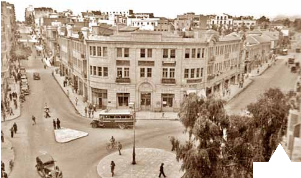
אחרי פרעות תרפ"ט התחדדה חלוקת העיר והיזם הערבי נאלץ למכור את הבניין. בית סנסור, 1936. מימינו רחוב יפו ומשמאלו רחוב בן־יהודה