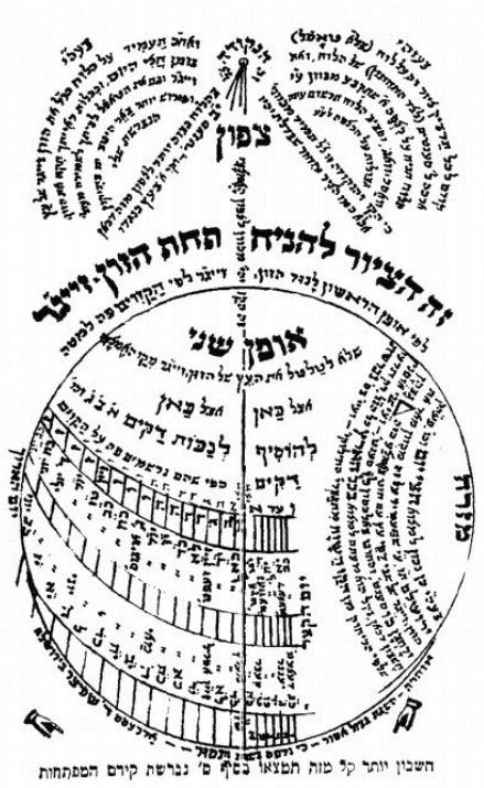
"זה הציור להניח תחת הזון" זיגור. תרשים לשעון שמש מתוך הספר 'נברשת לנץ החמה בציון'