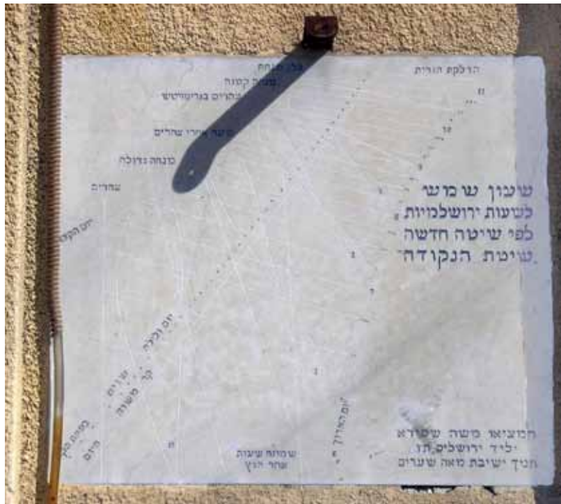
אחד משלושת שעוני השמש שבנה שפירא בגלותו על קיר בית הכנסת הגדול בפתח תקוה